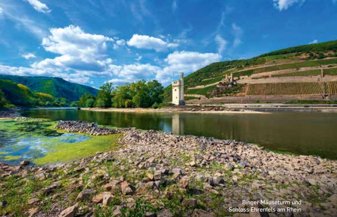
Binger Mäuseturm und Schloss Ehrenfels am Rhein